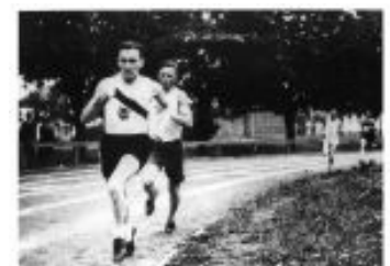
Wielki sportowiec, żołnierz i patriota.