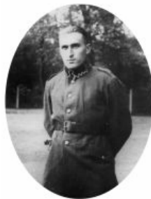
W mundurze żołnierza 360 pułku piechoty.

nie maturę i otrzymał świadectwo dojrzałości. W 1926r. rozpoczął szkolenie sportowe w biegach na 800m i 1500m pod kierunkiem Aleksandra Klumberga, który był autorem tzw. metody interwałowej (metoda treningu długodystansowego). Karierę sportową przerwał wybuch II wojny światowej. Dnia 26.03.1940r. został aresztowany przez Gestapo i rozstrzelany 21.06.1940r. w Palmirach.